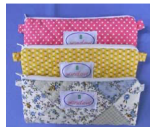
キルティング製品