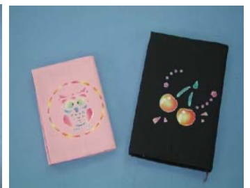
手染め製品（お弁当袋・裏付手提げ・ブックカバー）