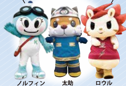
ノルフィン 太助 ロウル